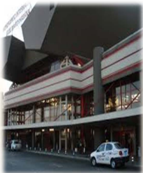
Empleo de Pasajeros

Introducción de drogas en operaciones por vía aéreas organizadas por cubanos residentes en EE.UU.