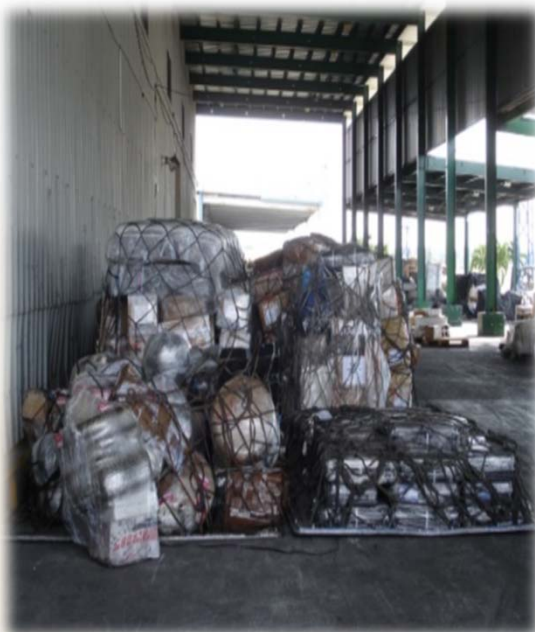
Cargas no acompañadas