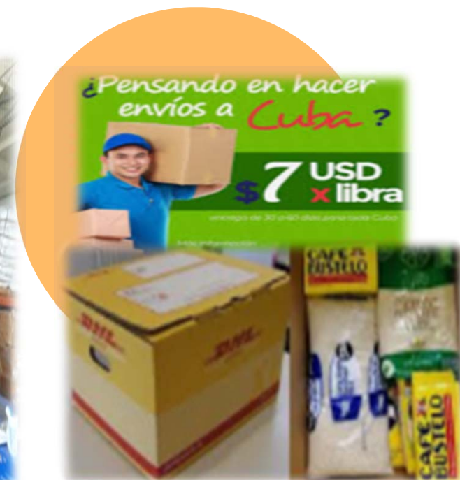
Agencias de paquetería