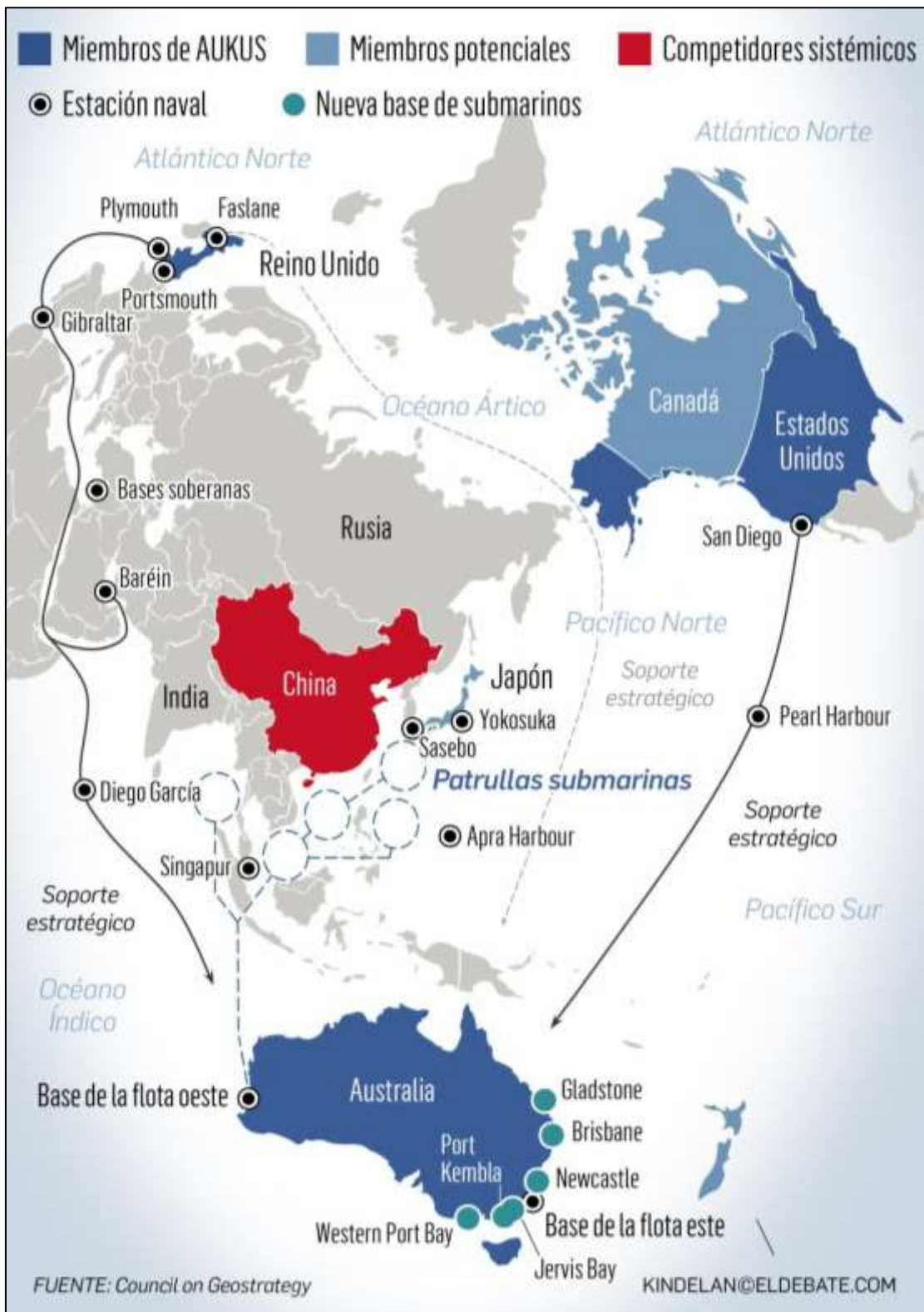
Figura 3. Geografía del AUKUS