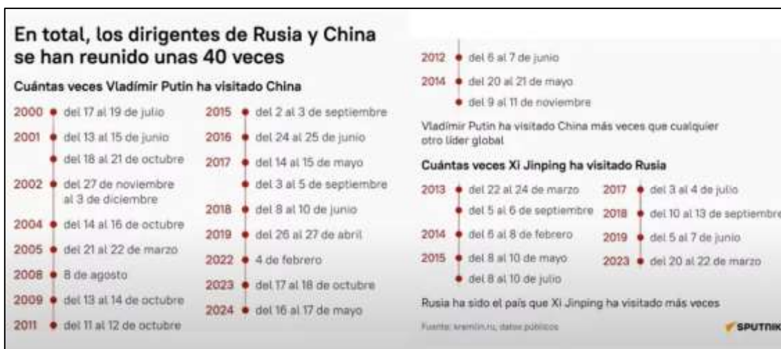
Figura 1. Visitas de Putin a China y Xi Jinping a Rusia

Vladimir Putin y Xi Jinping firmaron una Declaración conjunta sobre la profundización de la asociación estratégica de colaboración integral en la nueva era, con motivo del 75° aniversario del establecimiento de relaciones diplomáticas entre los dos países. El encuentro ocurrió en Pekín en el mes de mayo del presente año.