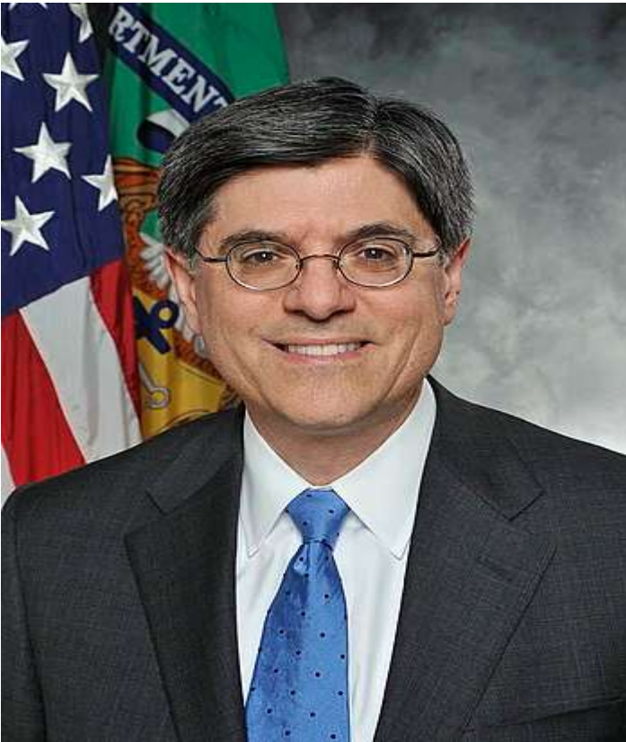
Jack Lew, ex-secretario del Tesoro 2013-2017

“Y cuanto más condicionamos el uso del dólar y de nuestro sistema financiero a la adhesión a la política exterior estadounidense, más crece el riesgo de migración a otras monedas y otros sistemas financieros en el mediano plazo” (Lew, 2016)