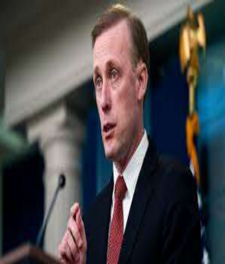
Jake Sullivan, asesor de SN

“No consideramos que los BRICS se conviertan en una especie de rival geopolítico de Estados Unidos o de cualquier otro país. Se trata de un conjunto muy diverso de países en su iteración actual -con Brasil, India, las democracias de Sudáfrica; Rusia y China como autocracias- con diferencias de opinión sobre cuestiones críticas en el Indo-Pacífico , en la guerra de Ucrania, en una... en una serie de otras cosas.”