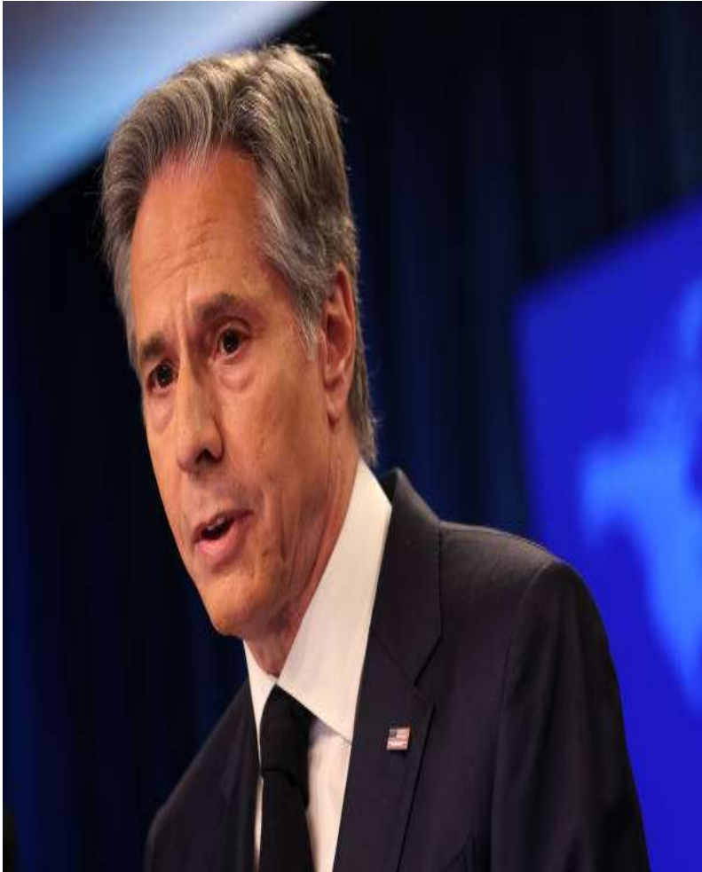
Anthony Blinken, Secretario de Estado

[...] hemos defendido durante mucho tiempo la propuesta de que los países deberían poder asociarse libremente con otros países en cualquier agrupación que quieran. Es algo que defendemos muy fuertemente y que hemos defendido durante mucho, mucho tiempo.”